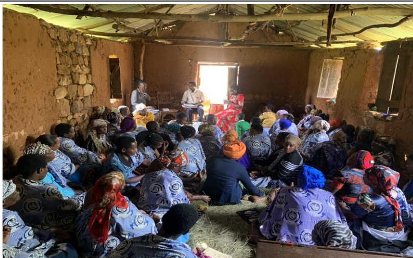
Picha 4. Afisa tathimini, Mkuu wa kitengo cha sheria kutoka MHOLA pamoja na Mwandishi wa Habari kutoka Kasibante FM walipotembelea kikundi cha WAWATA Bisore Kata ya Muhutwe Wilaya ya Muleba.