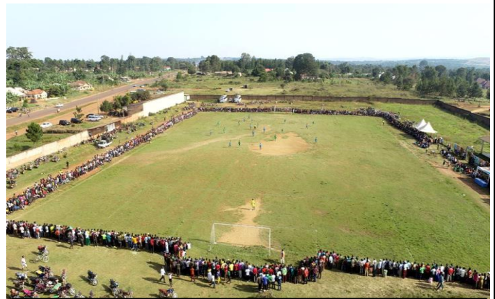
Picha 3: Mashindano ya MHOLA Mia Mia Cup 2021 yakiendelea uwanja wa CCM Muleba