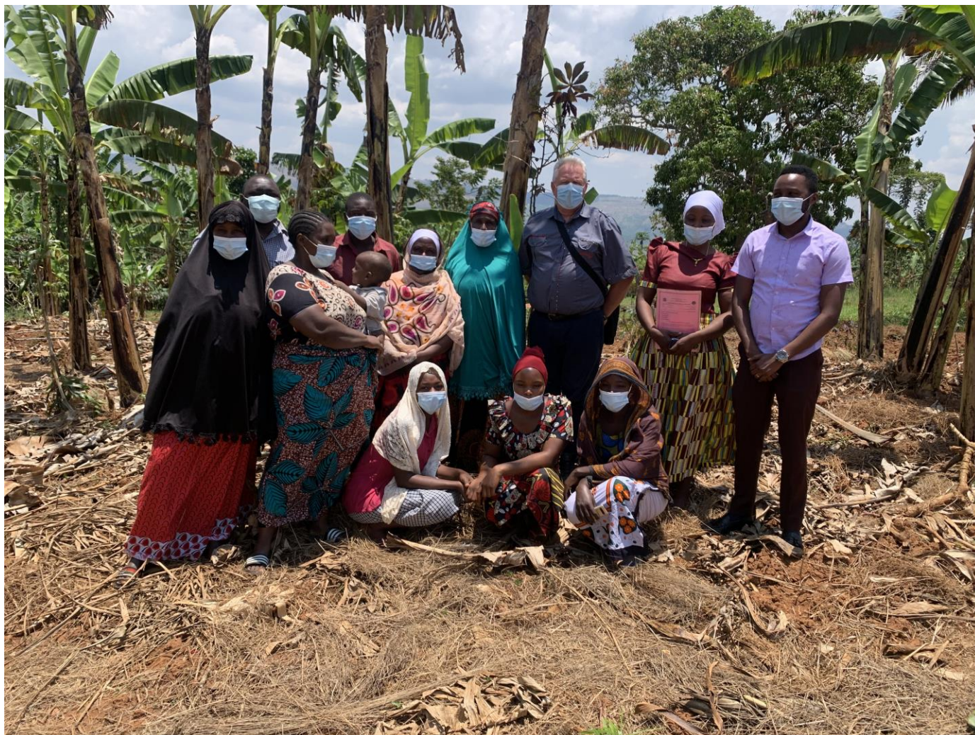
Picha 1: Wafanyakazi kutoka H3000 na MHOLA walipotembela mojawapo ya Kikundi kinachofadhiliwa na MHOLA