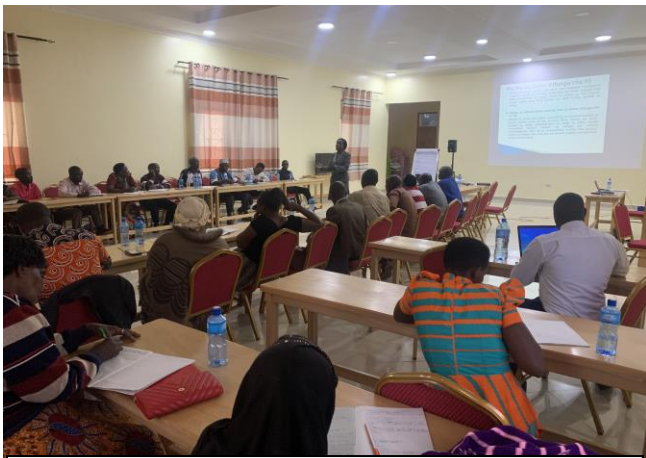
Picha 2: Viongozi 30 wa Kijamii wakijengewa uwezo katika ukumbi wa MHOLA