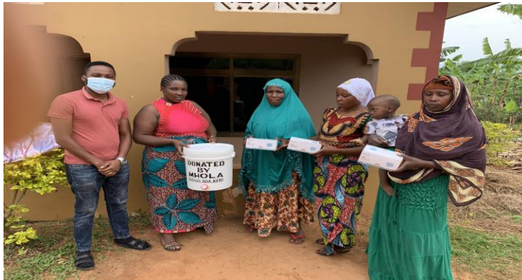
Picha 7: Afisa utuatiliaji na Tathimini wa MHOLA akitoa vifaa vya kupambana na UVIKO-19 kwa baadhi ya wanakikundi